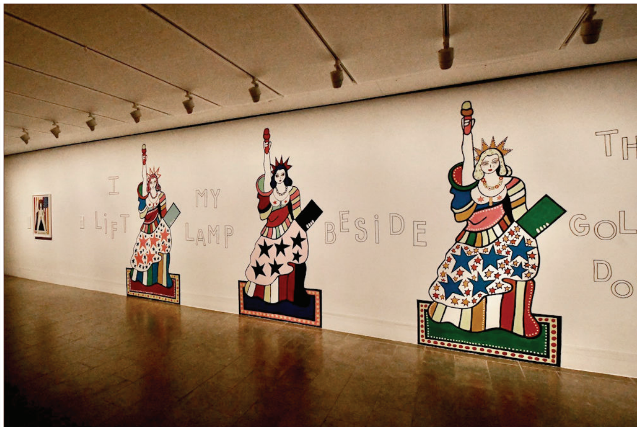
Tre farvestrålende frihedsgudinder, som Iannone skabte til The High Line i New York i 2018, indgår som vægmalerier. "My Liberties: Blonde, Red & Blue", 2019. Akryl på væg.

Tekst og fotos: Niels Lyksted Kunstnyt.dk 28. maj 2022