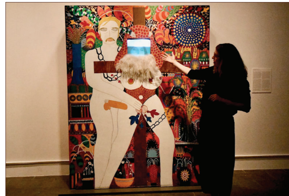
Blandt hovedværkerne i udstillingen er videoskulpturen "I Was Thinking of You", 1975. Værket viser en kvinde på korset (kunstnerens selv), der får en orgasme. Videoskulpturen blev beskyldt for at være pornografi - ikke blasfemi. Værket præsenteres her af udstillingens kurator Tine Colstrup.