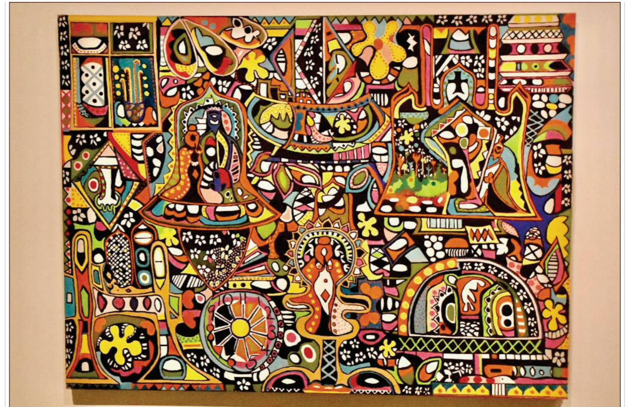
Dorothy Iannone indledte karrieren med abstrakte motiver på papir. Her er hun på vej til det figurative. "Jewel", 1967. Olie på lærred, 97 x 130 cm.