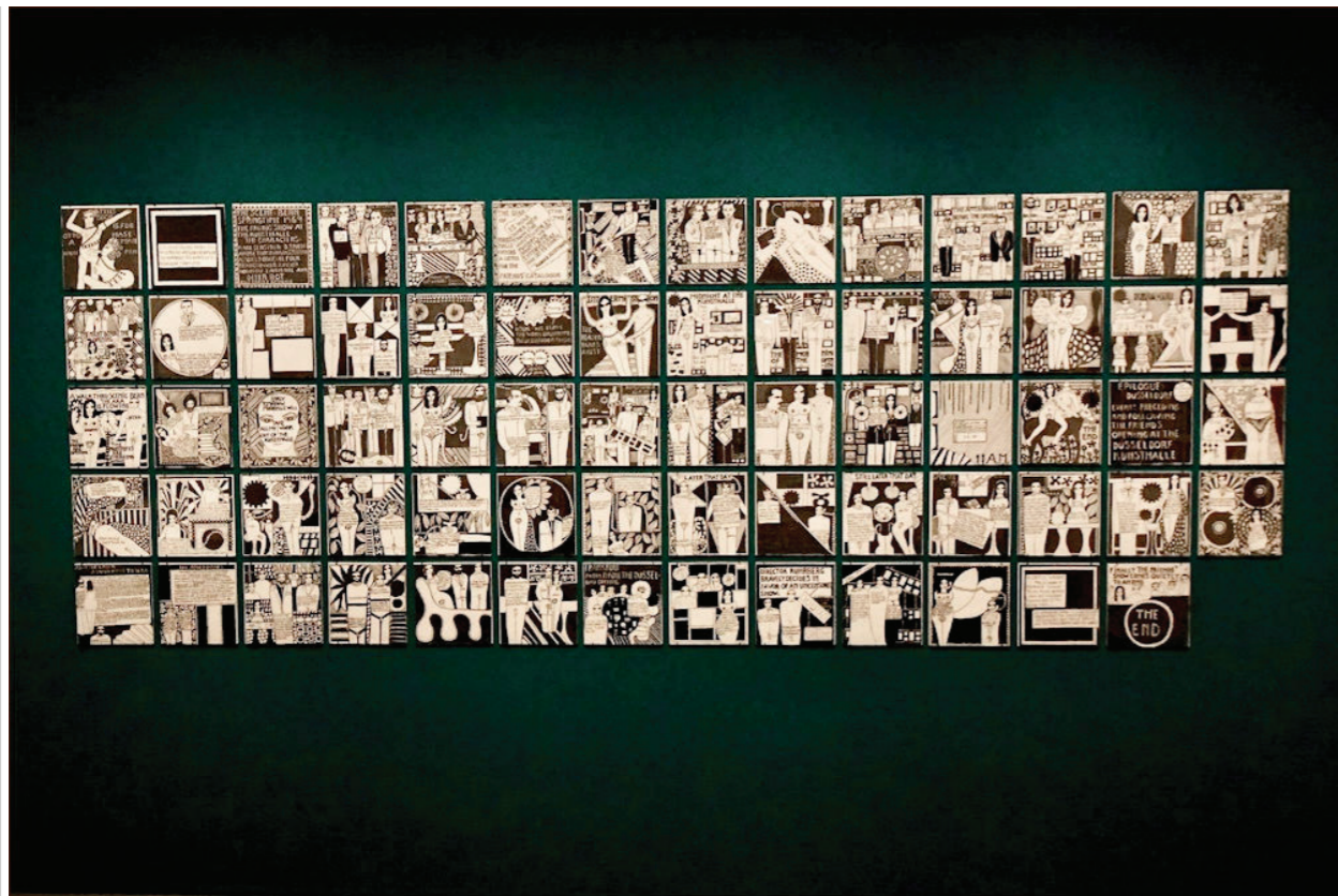
Mange værker har karakter af 'graphic novels', hvor håndskrevne tekster og billeder tilsammen fortæller historierne – bramfrit og med humoren indlejret i både sproglige og billedmæssige detaljer. Her: "The Story of Bern (or) Showing Colors", 1970.